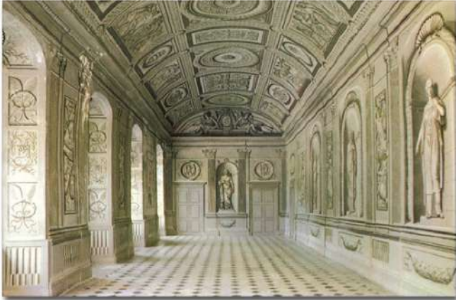
La Grande Galerie en trompe-l'oeil