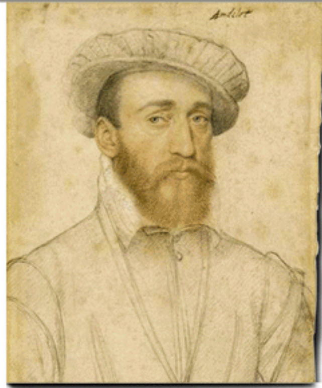
François d'Andelot par Clouet et l'aigle des Coligny