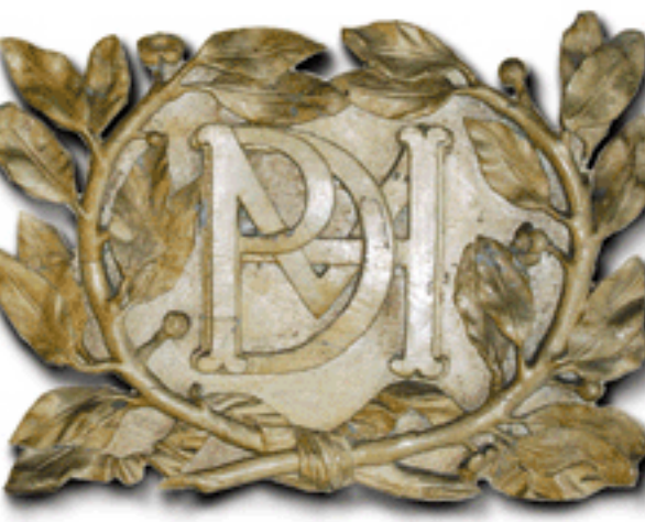
De Michel Particelli au "Sieur Particelle d'Hemery"

D e 1643 à 1648, Michel Particelli, surintendant des finances de Mazarin, fait achever le château. L'architecte Pierre Le Muet réalise ce bel ensemble que constituent les grand et petit château, les communs, le parterre, et enfin le Grand Canal, dont la perspective s'achève sur le monumental nymphée. Rémy Vuibert, peintre ordinaire du Roi, réalise l'exceptionnelle galerie en trompe-l'oeil sur des cartons de Nicolas Poussin.