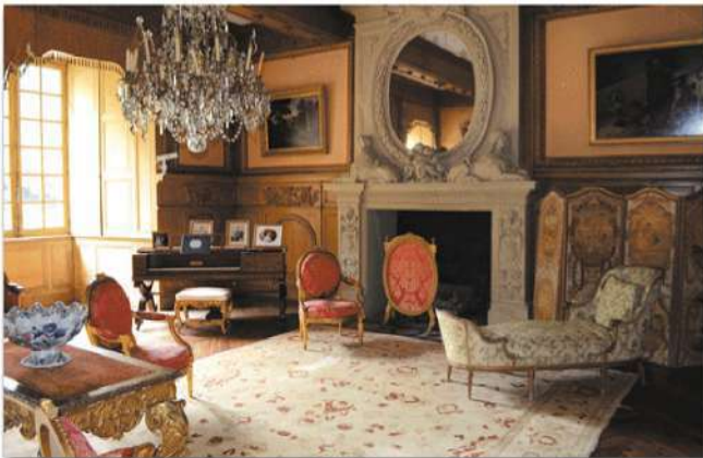
Le Salon de Compagnie