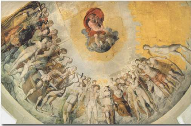
La fresque du Conseil Huguenot